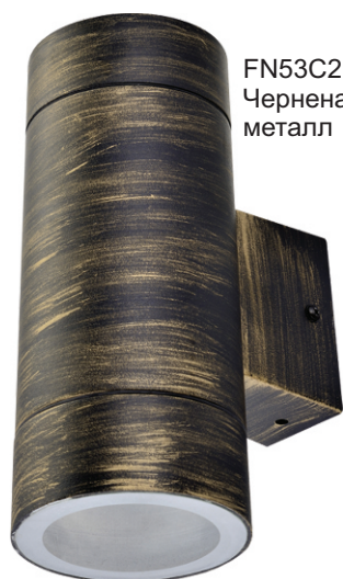
FN53C2ECH Черная бронза металл