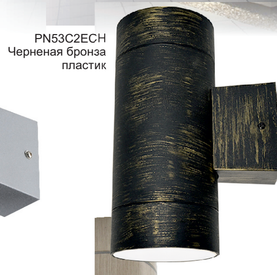
PN53C2ECH Черная бронза пластик