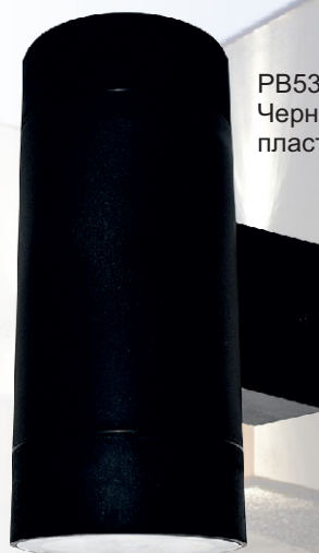
PB53C2ECH Черный пластик