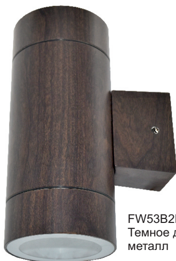
FW53B2ECH Темное дерево металл