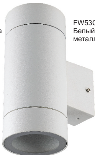
FW53C2ECH Белый металл