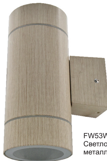
FW53W2ECH Светлое дерево металл