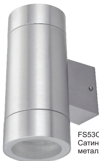
FS53C2ECH Сатин-хром металл