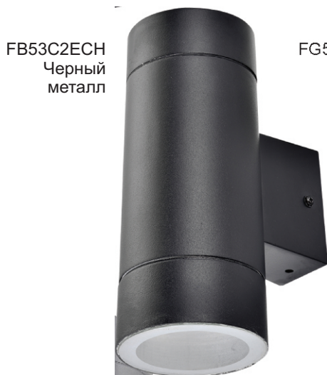
FB53C2ECH Черный металл